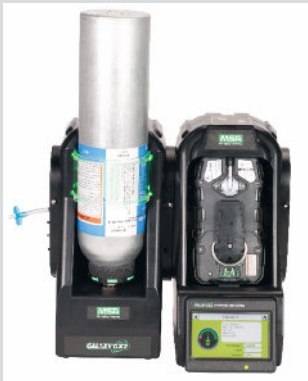
10128636 (Weitere Versionen erhältlich)