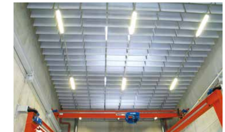
Schallabsorption in Industriehallen (Schallabsorptionsplatte)