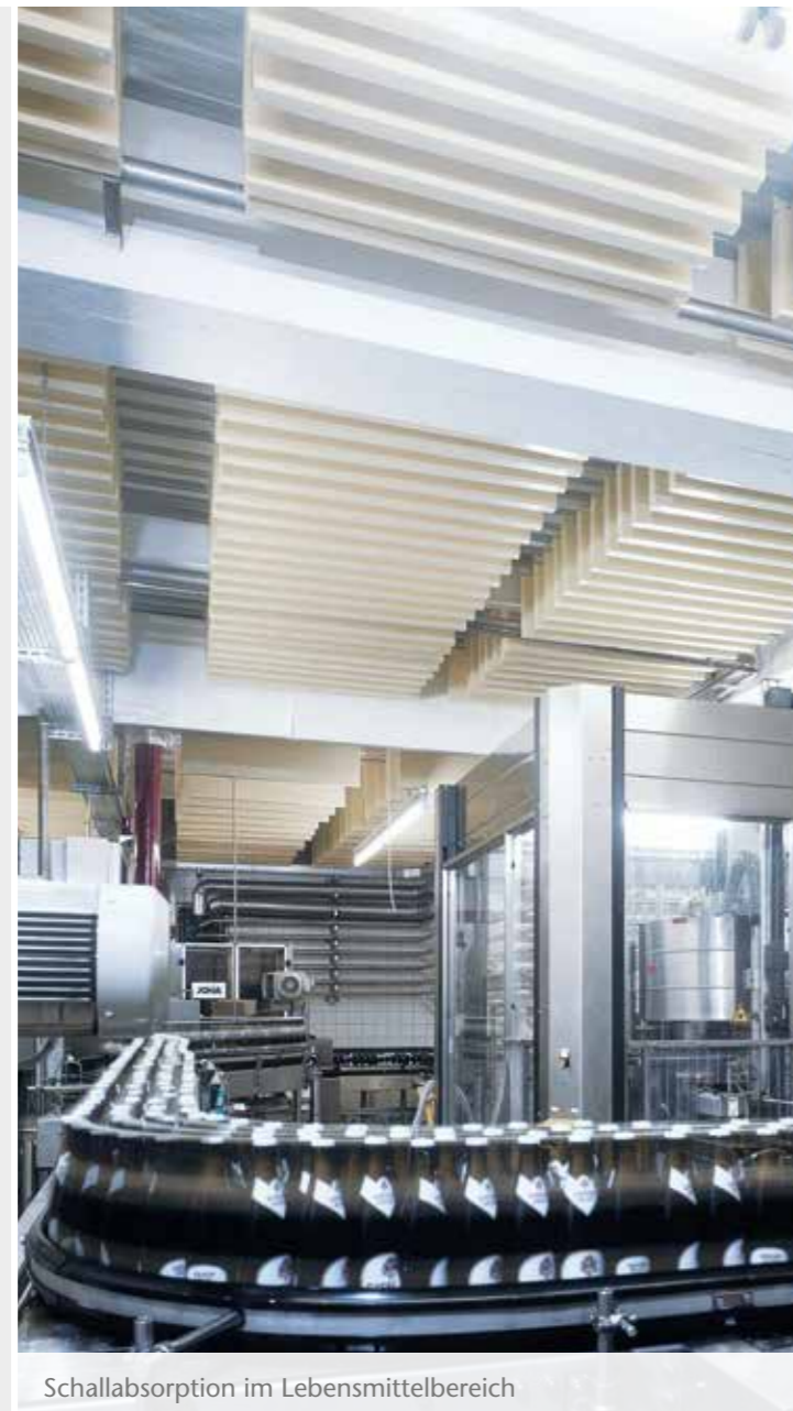
Schallabsorption im Lebensmittelbereich