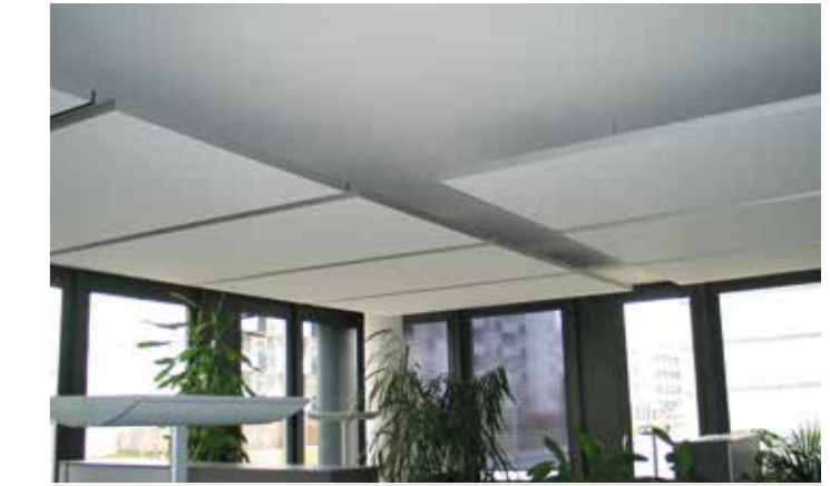
Schallabsorption in Büros (Deckensegel)

Sollte unter den TapeTec® Modulen kein geeigneter Absorber sein, finden wir sicher ein anderes Material in unserem weitgefächerten Sortiment. Wir arbeiten mit bekannten Herstellern im Bereich der Akustiklösungen zusammen.