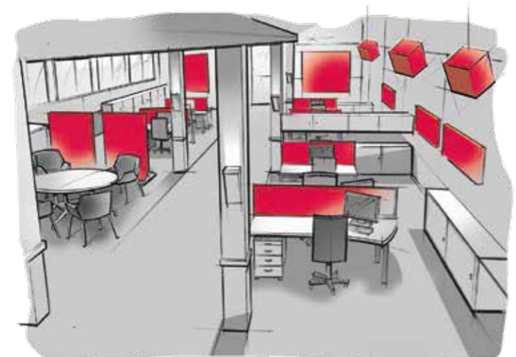
Schallabsorption in Büroräumen