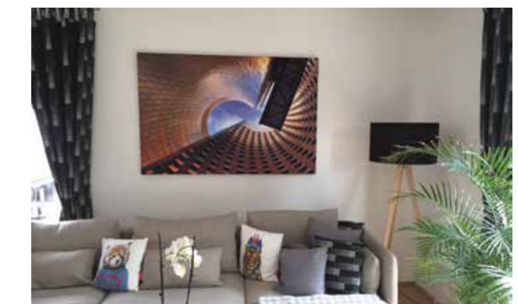
Schallabsorption in privaten Räumen (Akustikbild)